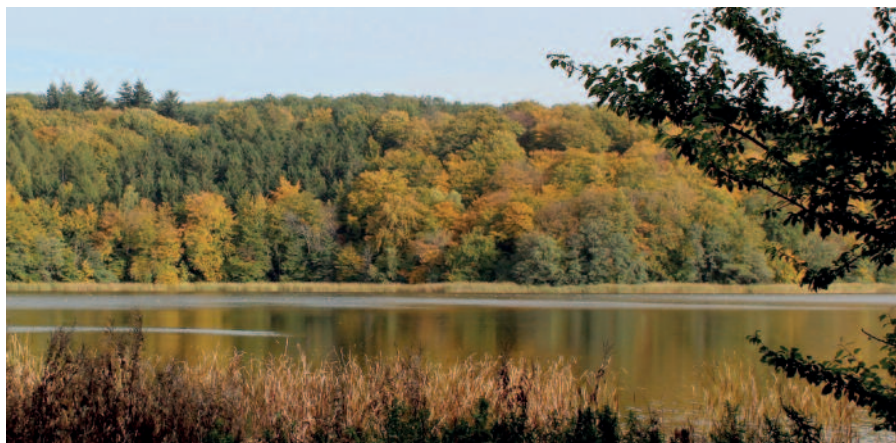
Bagsværd sø okt. 2012

Nu falmer skoven trindt om land, og fuglestemmen daler, nu storken flyver over strand, ham følge viltre svaler.